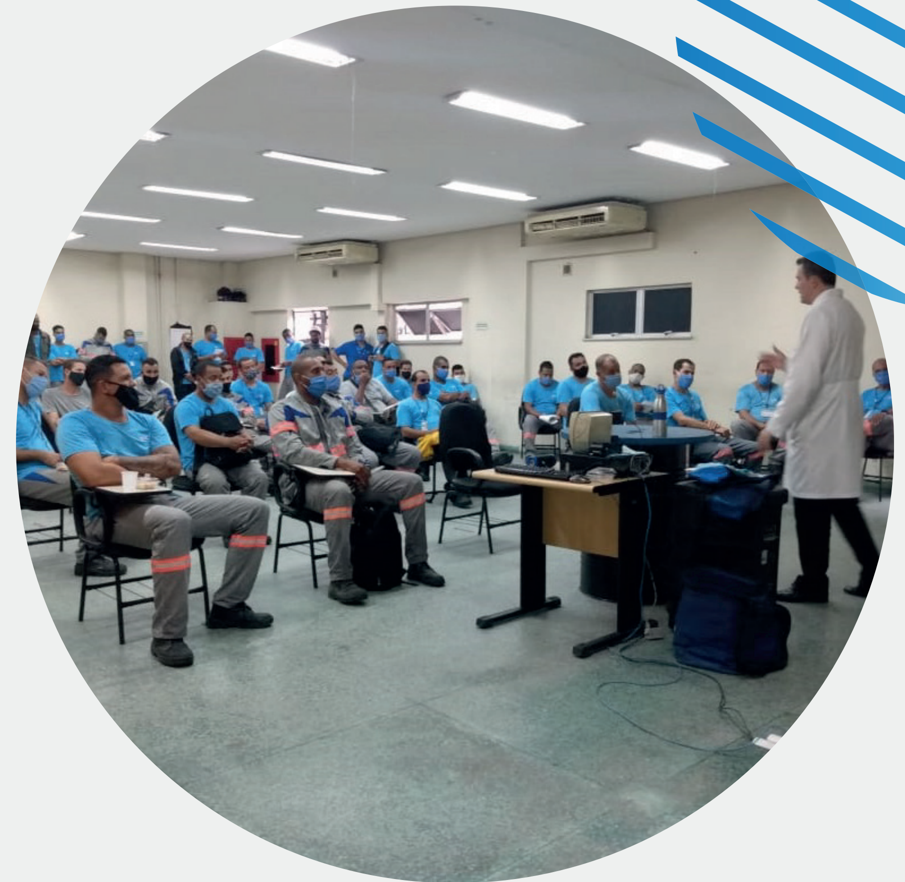
Palestra presencial Dezembro Vermelho

Em 2020, a 3C Services ofereceu ao colaborador um gama de palestras em prol da saúde como Outubro Rosa, Novembro Azul, Combate a Aids, Prevenção ao suicídio, etc.