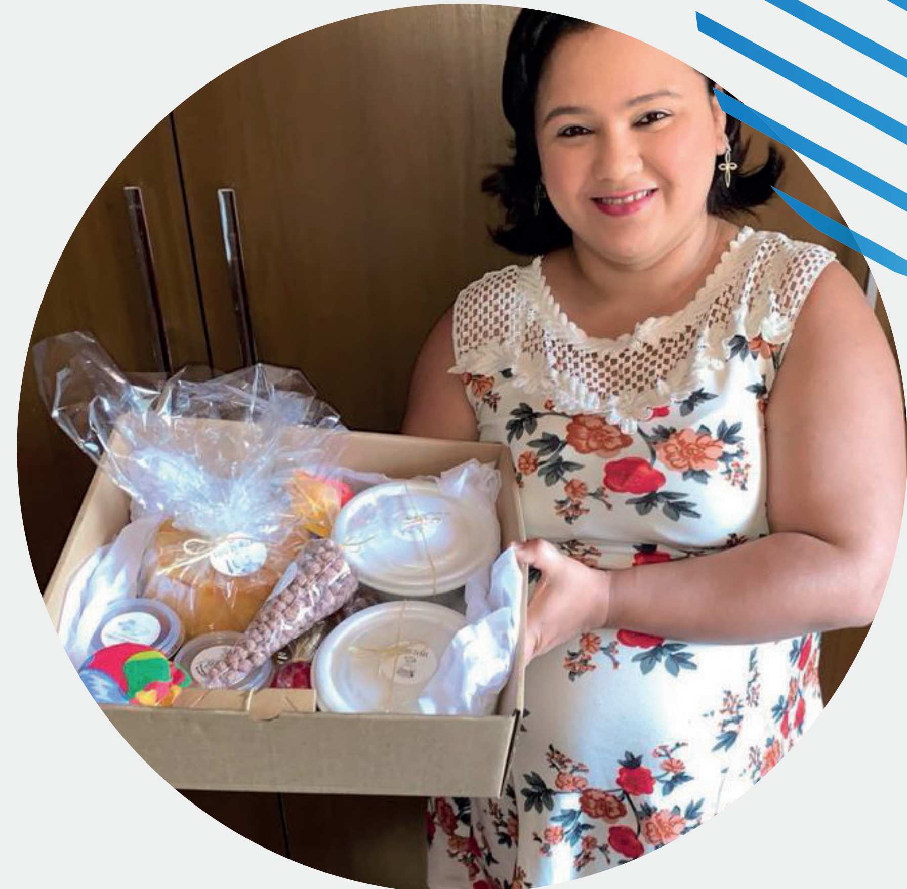
Caixa típica para festa Julina on-line